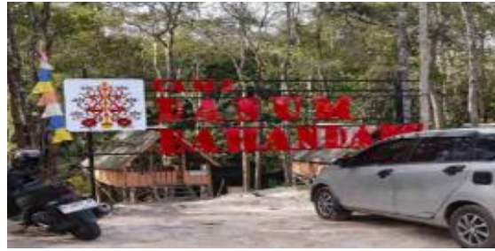
Gambar 2. Area Camp. (Sumber: Dokumentasi Penulis, 2026).