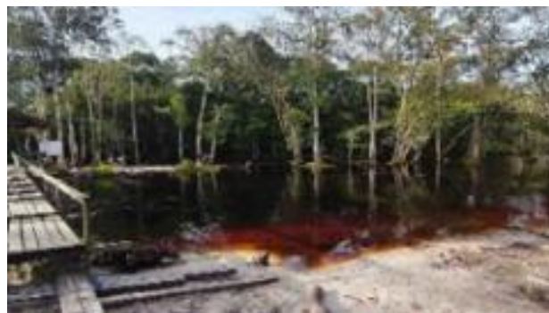
Gambar 1. Sungai Danum Bahandang.

Seiring waktu, kawasan yang semula hanya dimanfaatkan untuk aktivitas pribadi mulai menarik perhatian masyarakat yang datang untuk menikmati suasana alam di sekitar sungai. Melihat semakin banyaknya pengunjung yang datang, pengelola kemudian melakukan penataan kawasan secara bertahap dengan membersihkan area sungai serta menambahkan beberapa fasilitas sederhana. Firman Djuda juga menyampaikan bahwa pengembangan wisata tersebut mulai berjalan dan beroperasi sekitar tahun 2021. Hal ini sebagaimana dijelaskan bahwa “pengembangan wisata ini di mulai sekitar tahun 2020 waktu masa COVID, lalu mulai beroperasi sekitar tahun 2021.” (Firman Djuda, wawancara 2026).