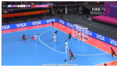
Gambar 7. Proses Gol ke dua

Terjadinya goal kedua dengan memanfaatkan bola mati yang melalui corner kick , di saat pemain Portugal Ricardinho melakukan corner kick pemain Argentina terlalu fokus pada pandangan corner kick sehingga pemain portugal Pany berdiri bebas di luar kotak penalti.