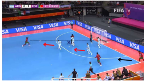
Gambar 6. Proses Gol ke dua

Terjadinya goal kedua dengan memanfaatkan bola mati yang melalui corner kick , di saat pemain Portugal Ricardinho melakukan corner kick pemain Argentina terlalu fokus pada pandangan corner kick sehingga pemain portugal Pany berdiri bebas di luar kotak penalti.