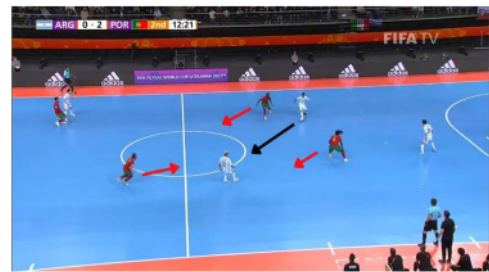
Gambar 8. Proses Gol ke tiga

Dengan posisi yang tidak terjaga pemain Portugal Pany dapat memanfaatkan umpan chip dari Ricardinho yang diakhiri dengan tendangan voli dari Pany yang menghasilkan gol indah dan sulit untuk diblok pemain Argentina beserta kiper dan score menjadi 2-0 di babak kedua pada menit 12:26 dari hitungan mundur yang dimulai bermain pada menit 20:00.