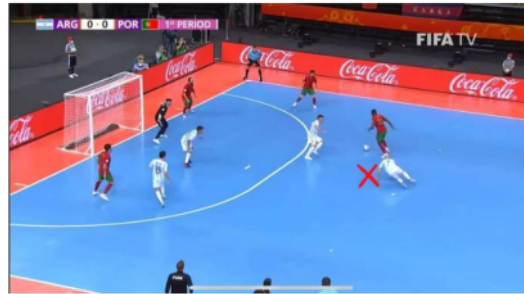
Gambar 3. Proses Gol Pertama

Kemudian masuklah pemain Argentina Santiago Basile setelah 2 menit waktu berjalan lalu pemain Portugal melakukan dribbling dengan melewati satu pemain dengan melakukan shooting keras yang mengarah ke kanan gawang dari kiper