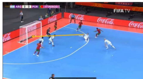
Gambar 5. Proses Gol Pertama

Kemudian masuklah pemain Argentina Santiago Basile setelah 2 menit waktu berjalan lalu pemain Portugal melakukan dribbling dengan melewati satu pemain dengan melakukan shooting keras yang mengarah ke kanan gawang dari kiper