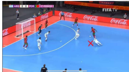
Gambar 4. Proses Gol Pertama

Kemudian masuklah pemain Argentina Santiago Basile setelah 2 menit waktu berjalan lalu pemain Portugal melakukan dribbling dengan melewati satu pemain dengan melakukan shooting keras yang mengarah ke kanan gawang dari kiper