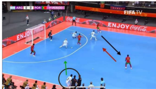
Gambar 2. Proses Gol Pertama

Pemain Timnas Argentina kehilangan satu pemain dikarenakan kartu merah, kemudian melakukan defend 3 orang, setelah bola dikuasai pemain Portugal Tiago Brito, pemain Argentina memasuki lapangan dengan 4 orang dan timnas Argentina melakukan defend dengan 4 orang lalu Tiago Brito melakukan passing terhadap rekannya Pany yang berdiri sedikit bebas tanpa ada pengawalan