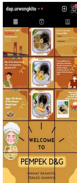
Gambar 6. Tampilan Feeds di Halaman Utama Profil

Foto produk yang berkualitas juga sangat berpengaruh terhadap keputusan pembelian dalam digital marketing. Karena ketika calon pembeli mengunjungi platform digital, mereka tidak mengetahui bagaimana produk tersebut, sehingga mereka hanya melihat produknya berdasarkan foto. Selain itu, dengan kualitas foto yang bagus akan membuat barang sederhana terlihat seperti barang yang memiliki nilai jual yang tinggi dan mempermudah calon konsumen untuk mengingat produk yang dijual hanya dengan foto produk yang berkualitas. Oleh karena itu kami juga melakukan pendampingan foto produk dengan memanfaatkan properti berupa bahan dan barang yang berada dirumah.