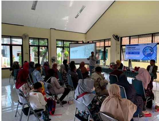
Gambar 2. Pelatihan Digital Marketing

minuman sehat yaitu juice, peralatan alat tulis kantor, perlengkapan aquarium, dan budidaya burung.