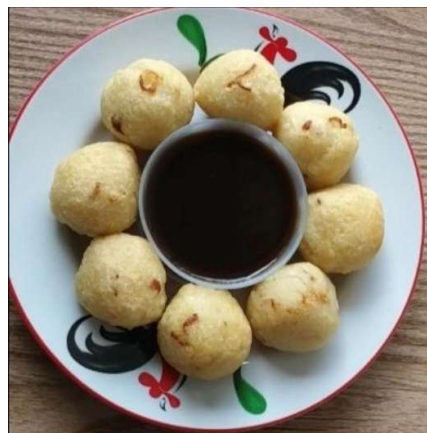
Gambar 7. Foto Produk Sebelum Dilakukan Pendampingan

Foto produk yang berkualitas juga sangat berpengaruh terhadap keputusan pembelian dalam digital marketing. Karena ketika calon pembeli mengunjungi platform digital, mereka tidak mengetahui bagaimana produk tersebut, sehingga mereka hanya melihat produknya berdasarkan foto. Selain itu, dengan kualitas foto yang bagus akan membuat barang sederhana terlihat seperti barang yang memiliki nilai jual yang tinggi dan mempermudah calon konsumen untuk mengingat produk yang dijual hanya dengan foto produk yang berkualitas. Oleh karena itu kami juga melakukan pendampingan foto produk dengan memanfaatkan properti berupa bahan dan barang yang berada dirumah.