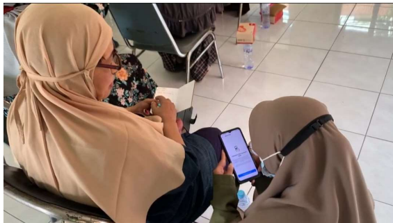
Gambar 3. Pembuatan dan Perubahan Akun Instagram Pada Audiens