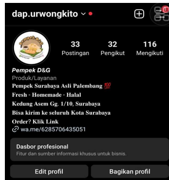
Gambar 4. Tampilan Bio Instagram Pempek D&G

konten yang nantinya akan di upload di halaman profil utama atau feed instagram dengan pemberian caption dan hastag yang relevan terhadap produk sesuai dengan pengetahuan yang telah didapatkan pada pelatihan digital marketing waktu lalu. Dan terakhir melakukan pendampingan cara mengoperasikan instagram seperti membagikan foto di feeds, story, dan menyimpannya di sorotan instagram.