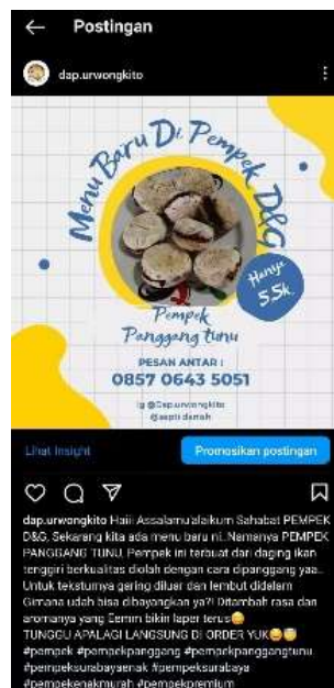
Gambar 9. Pempek D&G Dapat Mengoptimalkan Instagram Secara Mandiri

Dan hasil dari pendampingan pada Pempek D&G adalah bahwa pempek D&G telah memahami fungsi fitur-fitur yang ada didalam Instagram. Selain itu pempek tersebut juga telah memahami langkah-langkah dalam mengoperasikan Instagram sehingga dalam pelaksanaan mengoptimalkan Instagram sebagai media promosi dapat dilakukan secara maksimal dan mandiri serta menjadi lebih kreatif dalam pembuatan konten promosi. Dengan Pemahaman fungsi fitur-fitur di Instagram dan langkah mengoperasikannya, diharapkan pempek D&G dapat mempertahankan dan meningkatkan pembuatan konten promosi di Instagram. Berikut hasil dari pendampingan pada pempek D&G: