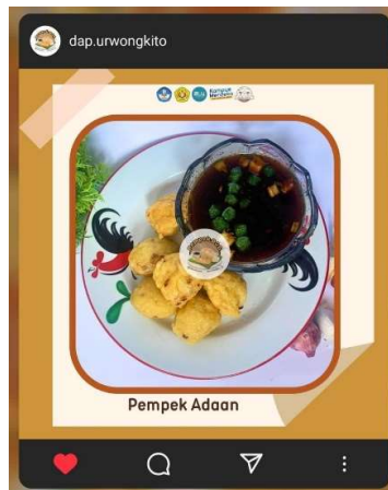
Gambar 8. Foto Produk Dalam Feeds Setelah Dilakukan Pendampingan