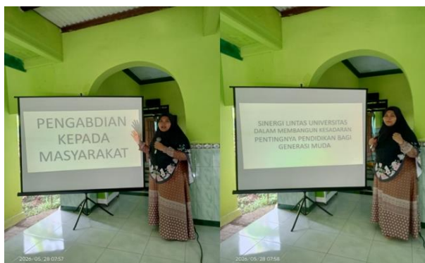
Gambar 1. Proses pelaksanaan pengabdian kepada Masyarakat.

Kolaborasi antar universitas memberikan dampak positif dalam memperkaya perspektif dan metode penyampaian materi. Setiap perguruan tinggi membawa keunggulan masing-masing, baik dari sisi keilmuan, pendekatan sosial, maupun inovasi pembelajaran. Hal ini membuat kegiatan pengabdian menjadi lebih variatif, interaktif, dan mudah dipahami oleh masyarakat sasaran.