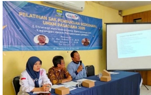
Gambar 2. Pelatihan SAK Pembukuan Sederhana menggunakan Accurate.

Peningkatan kapasitas pelaku UMKM melalui pendampingan dan pelatihan memiliki dampak signifikan terhadap kualitas laporan keuangan (Susanti et al., 2022). Selain itu, adopsi digitalisasi yang terjadi pada pelaku UMKM dalam kegiatan ini juga sejalan dengan temuan Pramono et al. (2023) yang menekankan pentingnya kesiapan pengguna dalam implementasi digital accounting.