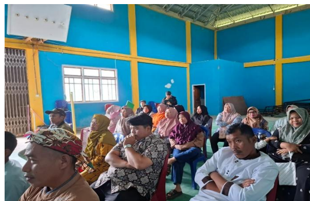
Gambar 3. Peserta Pelatihan SAK Pembukuan sederhana.

Melalui kegiatan pengabdian yang dilakukan secara partisipatif, ditemukan bahwa intervensi berupa pelatihan dan pendampingan mampu menjadi solusi efektif dalam menjembatani kesenjangan tersebut. Peningkatan kapasitas pelaku UMKM tidak hanya terjadi pada aspek pengetahuan, tetapi juga pada perubahan praktik dan perilaku dalam pengelolaan keuangan. Hal ini menunjukkan bahwa pendekatan berbasis pemberdayaan (capacity building) memiliki peran penting dalam mendorong transformasi pengelolaan keuangan UMKM (UNDP, 2009).