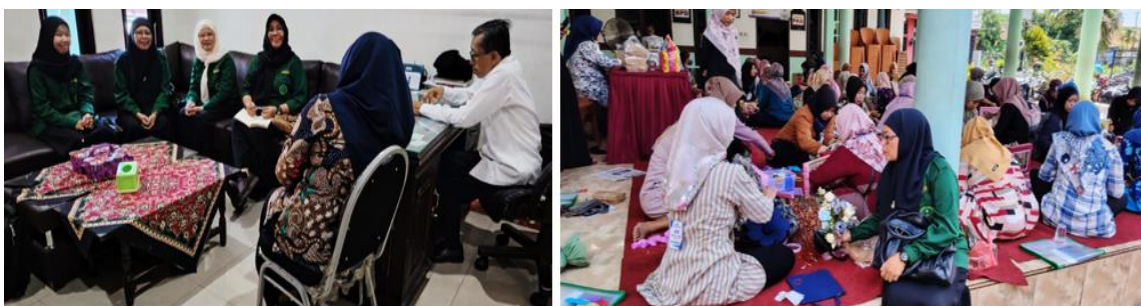
Gambar 1. Kegiatan Observasi Lapangan dan Diskusi Awal

Proses perencanaan kegiatan dilakukan melalui pendekatan community organizing , yaitu proses pengorganisasian masyarakat yang melibatkan partisipasi aktif dari komunitas sasaran dalam merencanakan dan melaksanakan kegiatan. Pada tahap ini, dilakukan koordinasi antara tim pengabdian dengan perangkat desa dan pengurus PKK guna mengidentifikasi permasalahan dalam pengelolaan keuangan keluarga. Tahapan awal dilakukan melalui observasi lapangan dan diskusi awal dengan pengurus PKK dan perangkat desa untuk mengetahui kondisi masyarakat terkait literasi keuangan keluarga.