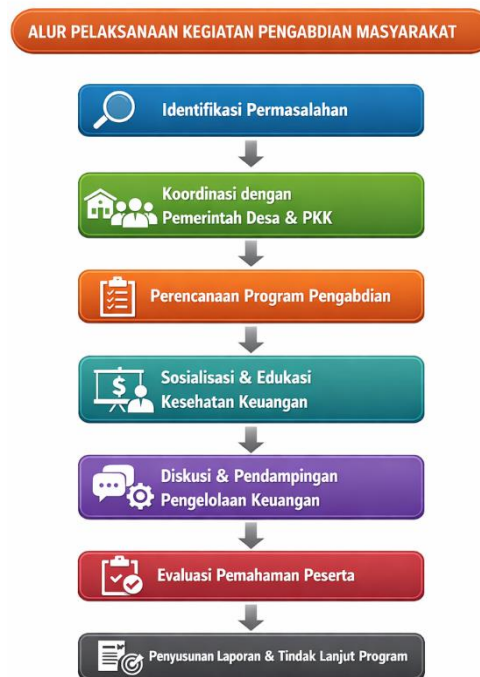
Gambar 2. Diagram Alur Pelaksanaan Pengabdian kepada Masyarakat