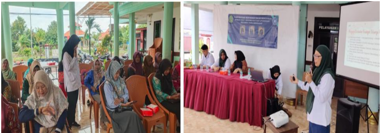
Gambar 5. Pelaksanaan Kegiatan PkM

Dari keseluruhan kegiatan, pengabdian kepada masyarakat ini memberikan kontribusi positif terhadap peningkatan pemahaman dan kesadaran masyarakat mengenai kesehatan keuangan keluarga. Melalui edukasi dan pendampingan, masyarakat diharapkan mampu mengelola keuangan rumah tangga secara lebih bijak guna mendukung kesejahteraan keluarga secara berkelanjutan.