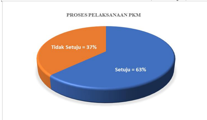
Gambar 4. Evaluasi Proses Pelaksanaan PkM

Hasil dari kegiatan pengabdian masyarakat ini menunjukkan adanya beberapa perubahan positif dalam komunitas masyarakat Desa Ngaresrejo, khususnya pada kelompok ibu-ibu PKK.