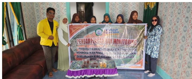
Gambar 5. Evaluasi Kegiatan

Setelah kegiatan Tutorial dilaksanakan, Komunitas petani kemudian melaksanakan kegiatan pengembangan dan produksi produk yang telah dilatih dalam lokakarya sebelumnya. Selama dua minggu, proses ini dilaksanakan dan diimplementasikan oleh masyarakat untuk mengembangkan variasi produk olahan salak. Setelah itu, Tim pengabdian masyarakat melakukan proses evaluasi.