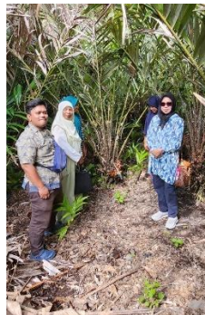
Gambar 4. Kunjungan ke kebun Salak Warga

Setelah kegiatan Tutorial dilaksanakan, Komunitas petani kemudian melaksanakan kegiatan pengembangan dan produksi produk yang telah dilatih dalam lokakarya sebelumnya. Selama dua minggu, proses ini dilaksanakan dan diimplementasikan oleh masyarakat untuk mengembangkan variasi produk olahan salak. Setelah itu, Tim pengabdian masyarakat melakukan proses evaluasi.