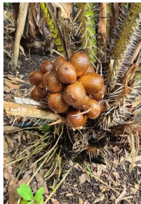
Gambar 3. Tanaman Salak Bobo

Acara di mulai dengan melakukan pembukaan. Untuk sambutan dan perkenalan, acara dimulaila dengan menyambut hangat para peserta dan memperkenalkan diri panitia dan fasilitator lain yang terlibat dalam lokakarya. Moderator secara singkat menekankan pentingnya masyarakat lokal dan semangat kewirausahaan mereka. Kemudian, moderator meberikan gambaran umum proyek, berupa gambaran singkat tentang tujuan lokakarya. Di dalamnya juga menyoroti potensi buah salak sebagai makanan olahan dan bagaimana pelatihan akan membekali peserta untuk mengeksplorasi jalan ini. Moderator menekankan pentingnya kolaborasi dan berbagi pengetahuan dalam masyarakat dalam bingkai lokakarya sebagai platform untuk pembelajaran dan pertumbuhan kolektif