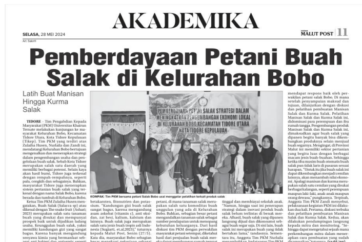
Gambar 7. Publikasi Koran

Hasil dari Pengabdian Masyarakat ini diwartakan dalam berbagai media. Dalam media Cetak, berita kegiatan ini ada pada Koran Malut Pos pada hari Selasa, tanggal 28 Mei 2024. Kemudian video-video kegiatan ini juga diupload pada sosial media