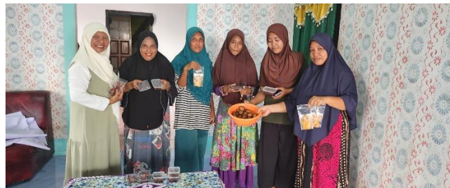
Gambar 6. Prototype Produk Kurma Salak dan Manisan Salak

Dalam proses evaluasi, ada beberapa kegiatan yang dilaksanakan. Pertama, sesi diskusi terbuka untuk menjawab pertanyaan atau masalah yang masih ada dari peserta. Dorong mereka untuk berbagi pemikiran dan pengalaman mereka dengan pemrosesan salak. Kemudian, umpan balik dan penilaian berupa diskusi dengan tujuan untuk mengumpulkan wawasan peserta tentang konten lokakarya, penyampaian, dan efektivitas keseluruhan. Selanjutnya, komunitas petani salak di Desa Bobo bekerja sama untuk mengembangkan rencana aksi dasar. Rencana ini dapat menguraikan langkah selanjutnya untuk inisiatif pemrosesan individu atau berbasis masyarakat.