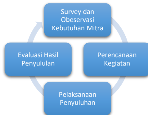
Gambar 2. Diagram Proses Kegiatan PKM

Pelaksanaan program pengabdian kepada masyarakat dengan tema Pemberdayaan Petani Salak Strategi dalam Meningkatkan Pengembangan Ekonomi Lokal di Kelurahan Bobo Kecamatan Tidore Utara Kota Tidore Kepulauan. Kegiatan ini berlangsung di Desa Bobo Pulau Tidore dengan memberikan penyuluhan terhadap para petani salak mengenai pentingnya variasi produk dalam mmasarkan produk salak Bobo, melakukan tutorial dan kegiatan evaluasi. Metode yang digunakan adalah ceramah, tanya jawab, dan tutorial. Waktu yang digunakan selama dua hari.