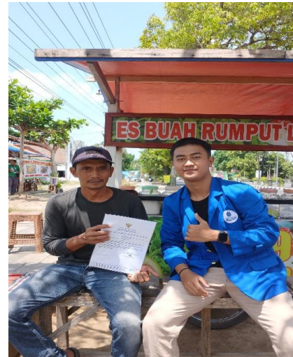
Gambar 4: Penyerahan dokumen NIB