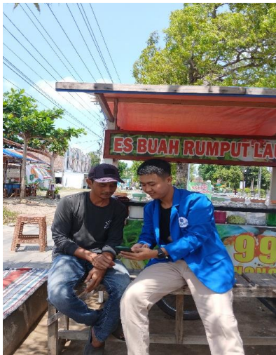
Gambar 3: Pengenalan Aplikasi Buku Warung