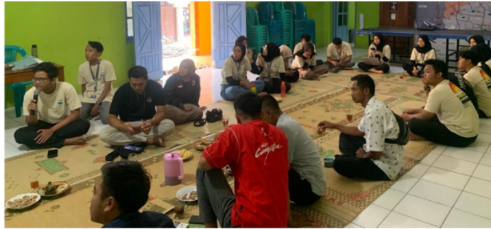
Gambar 3. Kegiatan pelatihan SDM pengelola wisata

Menyambung dengan program sebelumnya, kegiatan Pelatihan SDM Pemasaran berbasis Instagram juga dilaksanakan untuk mendukung penguatan promosi dan komersialisasi wisata di Desa Rowoboni. Dalam kegiatan ini disampaikan bagaimana kiat-kiat untuk melakukan promosi produk atau jasa melalui Instagram. Alasan menggunakan Instagram sebagai platform promosi karena Instagram memiliki basis pengguna yang besar. Selain itu, Instagram juga memiliki fitur Instagram Insight yang merupakan alat analisis yang dapat membantu penggunanya untuk menganalisis kinerja postingan dan efektivitas kampanye/promosi. Instagram juga saat ini sedang populer dijadikan sebagai media promosi berbagai jasa wisata ataupun desa wisata (Handayani and Adelvia 2020; Pradiatiningtyas 2016; Putria and Sugiartia 2021; Setiawan and Sama 2020). Beberapa materi yang disampaikan dalam kegiatan pelatihan ini antara lain: 1) Pengenalan Instagram untuk Pemasaran; 2) Membuat dan Mengelola Akun Instagram Bisnis; 3) Konten Instagram yang Efektif, seperti jenis konten, dan strategi konten; 4) Menggunakan Hashtag dan Geotag; DAN 5) Studi kasus