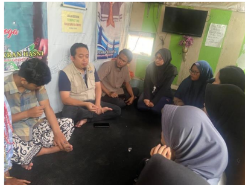
Gambar 4. Pelatihan SDM pemasaran

Kegiatan terakhir dari program pengabdian ini adalah Pelatihan Pembuatan Instagram dan Pendampingan Pengelolaan Instagram untuk tujuan promosi wisata. Materi yang disampaikan dalam kegiatan ini antara lain: langkah-langkah membuat Instagram, cara untuk membuat feed dan Instagram story, membuat konten sederhana dengan menggunakan canva, dan pembuatan content planer. Kegiatan ini dilaksanakan pada 1 Agustus 2024 di Desa Rowoboni dengan mengundang 10 orang peserta. Indikator keberhasilan dari kegiatan ini adalah tingkat partisipasi peserta, adanya Instagram promosi desa, dan adanya konten Instagram sederhana yang dibuat dengan Canva. Untuk tingkat partisipasi peserta dalam kegiatan ini dapat dikatakan cukup tinggi, karena kegiatan ini dihadiri oleh 6 peserta atau sekitar 60% dari jumlah undangan yang diberikan. Sedangkan untuk indikator sebagai berikut.