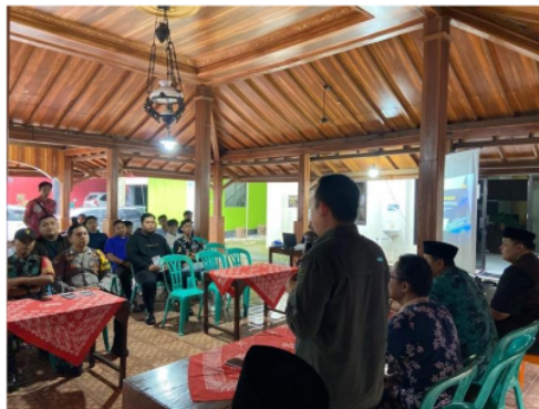
Gambar 2. Narasumber dalam kegiatan Sekolah POKDARWIS

Untuk memperkuat pengelolaan wisata di Desa Rowoboni, dilakukan Pelatihan SDM Pengelolaan Wisata. Pelatihan ini didasarkan pada hasil survei kepuasan wisatawan yang dilakukan terhadap wisatawan yang berkunjung ke lokasi wisata di Desa Rowoboni seperti, Muncul River Tubing dan Water Park Muncul. Survei ini kami laksanakan pada 11-13 Juni 2024 jumlah responden sebanyak 50 wisatawan. Teknik sampling dalam kegiatan survei ini adalah purposive random sampling, dengan kategori responden adalah pengunjung dewasa. Survei dilakukan terhadap kualitas pelayanan wisata dengan aspek-aspek seperti tangibles, reliability, responsiveness, assurance, dan empathy (Zeithaml and Parasuraman 2001; Zeithaml, Parasuraman, and Berry 1990).