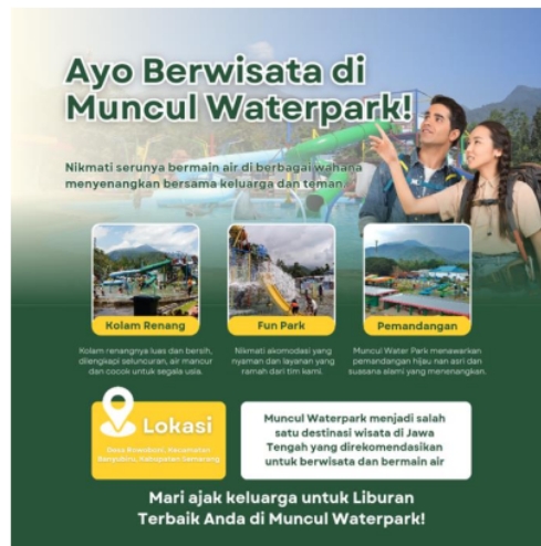
Gambar 7. Contoh poster promosi yang telah dibuat