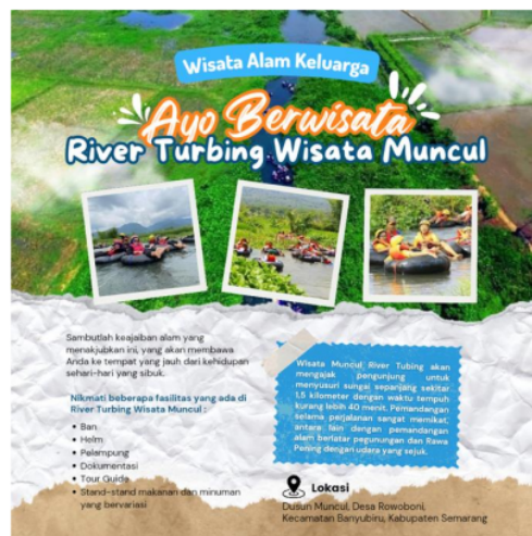
Gambar 6. Contoh poster promosi yang telah dibuat