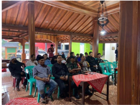
Gambar 1. Kegiatan Sekolah POKDARWIS (sumber: dokumentasi tim pengabdian, 2024)