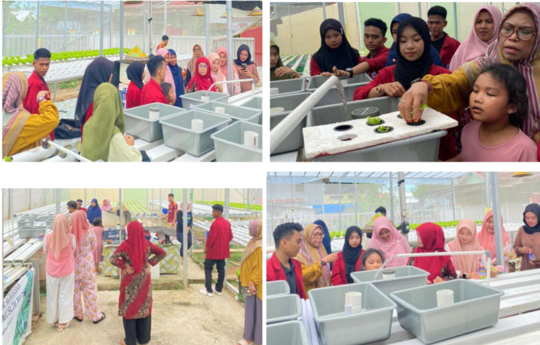
Gambar 4. Rangkaian Kegiatan Praktek dan Pelatihan Instalasi Hidroponik Pasang Surut dengan Bell-Siphon

Praktek instalasi dan demonstrasi kerja hidroponik dilakukan pada Greenhouse dengan mitra sebagai host. Rangkaian kegiatan praktek Instalasi ditunjukkkkan dalam Gambar 4.