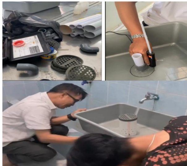
Gambar 3. Proses Instalasi dan uji kerja Bell-Siphon pada rangkaian Hidroponik

Manfaat utama Bell-siphon antara lain banyak aerasi untuk akar Tanaman , oksigenasi tanaman, Saat siphon mengalirkan air secara teratur, seluruh akar terkena udara secara teratur meningkatkan oksigen, sehingga pertumbuhan tanaman terbantu (Haq, 2019). Perakitan dilakukan sebelum Instalasi (Gambar 3)