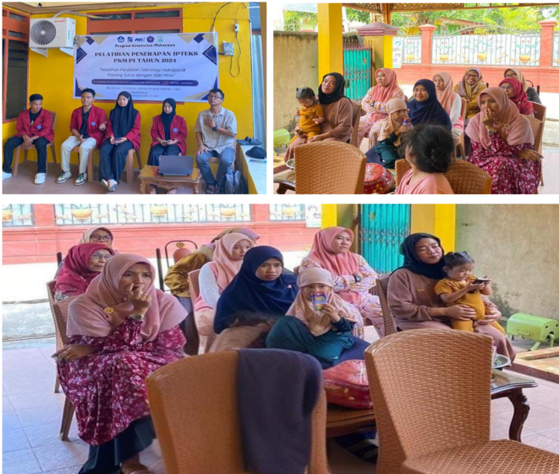
Gambar 1. Aktifitas Penyuluhan Mengenai Hidroponik Pasang Surut (Ebb-Flow)

Penyuluhan mengenai Keunggulan Hidroponik Pasang Surut dengan bell Siphon mengedepankan bagaimana Sistem Sederhana ini lebih hemat ruang, dan Potensi Produksi yang lebih baik dengan pertumbuhan tanaman yang baik.