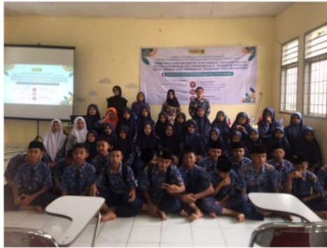
Gambar 2. Dokumentasi Kegiatan

menunjukkan bahwa program edukasi berhasil meningkatkan pemahaman siswa mengenai prinsip-prinsip gizi seimbang dan pentingnya pola makan yang sehat.