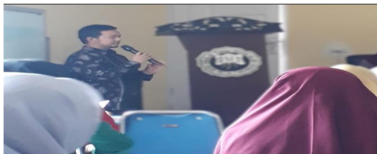
Gambar 4. Sosialisasi Proses Pendaftaran Sertifikasi Halal Skema Self Declare