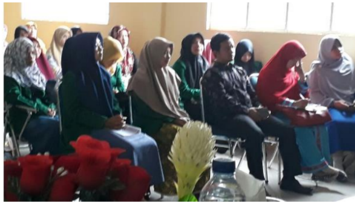
Gambar 6. Sosialisasi Pendaftaran Self Declare

Setelah pemaparan materi selesai, dilanjutkan dengan langkah pembelajaran Role Playing yang difasilitasi oleh mahasiswa yang menjadi bagian tim pengabdian. Tujuan pembelajaran ini adalah untuk meningkatkan pemahaman peserta terhadap materi sertifikasi halal skema self declare . Adapun tahapan role playing yang dilakukan mengadopsi tahapan yang dikenalkan oleh Shafel, yaitu: 1) Menghangatkan suasana dan memotivasi peserta didik, 2) Memilih partisipan/peran, 3) Menyusun tahap-tahap peran, 4) Menyiapkan pengamat, 5) Pemeranan, 6) Diskusi dan evaluasi, 7) Pemeranan ulang, 8) Diskusi dan Evaluasi, dan 9) Membagi pengalaman dan mengambil kesimpulan (Basri, 2017).