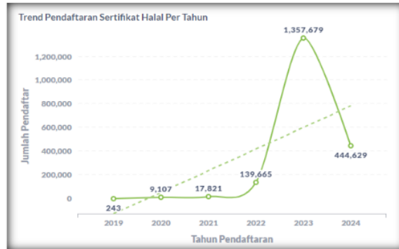
Gambar 1. Trend Pendaftaran Sertifikat Halal

Gambar diatas menunjukkan bahwa pendaftaran sertifikat halal mengalami kenaikan yang signifikan pada tahun 2023 menjadi 1.357.679 pendaftar atau naik sebesar 872% dibandingkan periode sebelumnya. Namun, hingga Mei 2024 jumlah pendaftaran baru mencapai 444.629 pendaftar. Diantara faktor penyebab terjadinya ketimpangan antara jumlah pelaku UMK dengan realisasi sertifikasi halal adalah kurangnya pengetahuan dan pemahaman akan pentingnya sertifikasi halal, proses pengajuan, serta persyaratan yang harus dipenuhi.