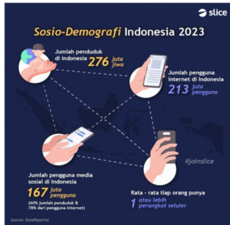
22 Gambar 1. Jumlah Pengguna Media Sosial di Indonesia Tahun 2023

Menurut data hasil riset Slice tahun 2023, diketahui 26 Indonesia merupakan Negara dengan pengguna media sosial yang cukup tinggi, yakni 60% dari jumlah penduduk Indonesia (Ref. Gambar 1. dan Gambar 2.). Itulah sebabnya penting bagi Ikaboga Indonesia untuk menguasai cara pemanfaatan media sosial sebagai media branding dan membangun reputasi yang baik.