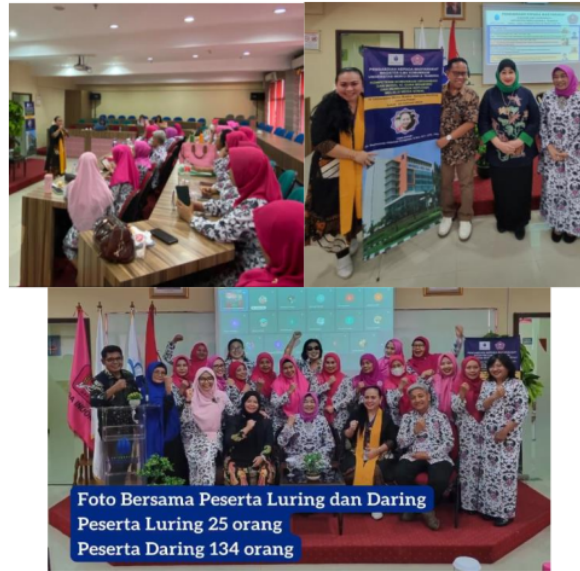
Gambar 7. Kegiatan PKM, 90,5% didominasi Perempuan

Pada acara ini juga dilakukan perjanjian kerjasama serta penyerahan plakat, dari dan kepada Universitas Mercu Buana dan DPP Ikaboga Indonesia (Ref. Gambar 8.)