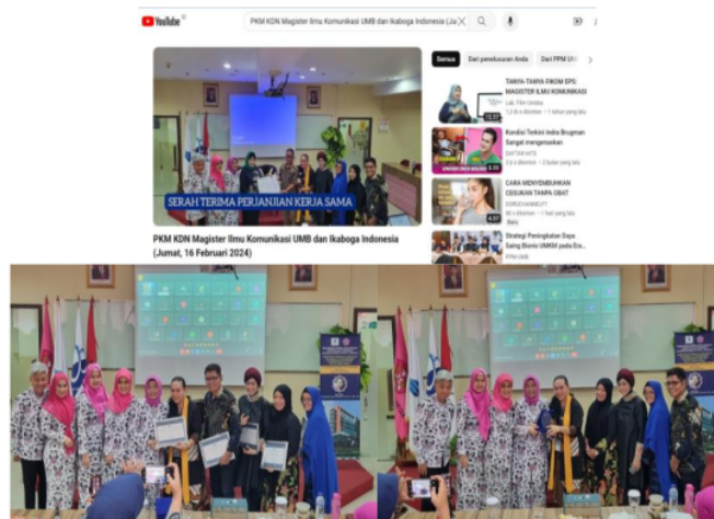
Gambar 8. Kegiatan PKM Pada Hari Jumat, 16 Februari 2024

Pada acara ini juga dilakukan perjanjian kerjasama serta penyerahan plakat, dari dan kepada Universitas Mercu Buana dan DPP Ikaboga Indonesia (Ref. Gambar 8.)