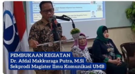
Gambar 5. Sekprodi Magister Ilmu Komunikasi Universitas Mercu Buana