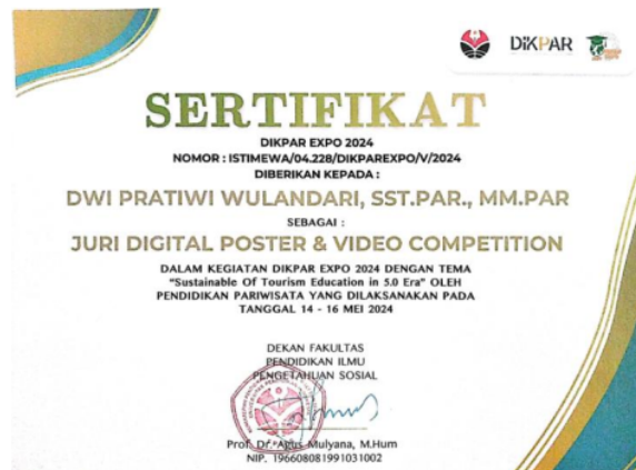
Gambar 2. Sertifikat Juri

Kegiatan ini berhasil menjalin kolaborasi yang kuat antara berbagai pihak, termasuk akademisi, praktisi pariwisata, komunitas pemuda, dan pemerintah daerah. Kolaborasi ini tidak hanya bermanfaat selama pelaksanaan kegiatan, tetapi juga menciptakan fondasi yang kuat untuk proyek-proyek pengabdian masyarakat selanjutnya. Hubungan yang terbentuk diharapkan dapat berlanjut dan berkembang, menciptakan sinergi yang positif untuk mempromosikan pariwisata berkelanjutan di masa depan.