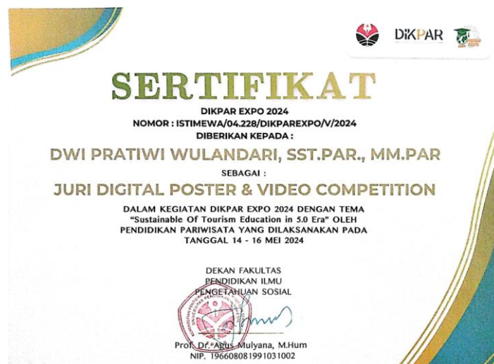
Gambar 2. Sertifikat Juri

Kegiatan ini berhasil menjalin kolaborasi yang kuat antara berbagai pihak, termasuk akademisi, praktisi pariwisata, komunitas pemuda, dan pemerintah daerah. Kolaborasi ini tidak hanya bermanfaat selama pelaksanaan kegiatan, tetapi juga menciptakan fondasi yang kuat untuk proyek-proyek pengabdian masyarakat selanjutnya. Hubungan yang terbentuk diharapkan dapat berlanjut dan berkembang, menciptakan sinergi yang positif untuk mempromosikan pariwisata berkelanjutan di masa depan.