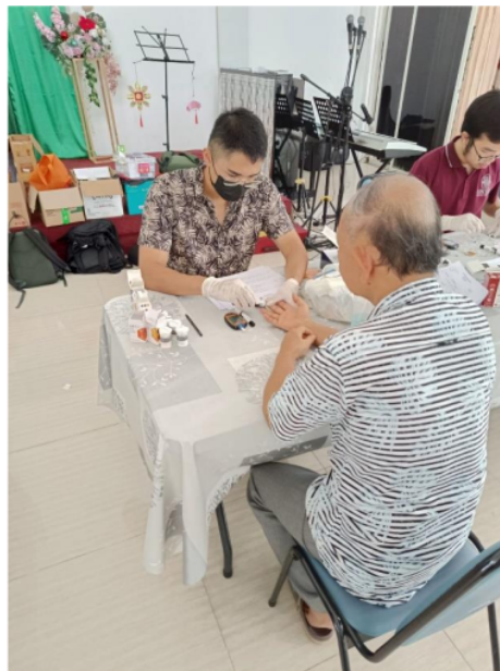
Gambar 1. Pemeriksaan Kadar Kolesterol Total

Kegiatan deteksi dini dilakukan di Panti Werda Hana, Tangerang Selatan yang ditujukan untuk populasi lansia, yang diikuti oleh 61 peserta. Seluruh peserta mendapat pemeriksaan darah 12 berupa kadar kolesterol total (Gambar 1). Interpretasi 12 hasil pemeriksaan kadar kolesterol total (Gambar 2) dilampirkan.