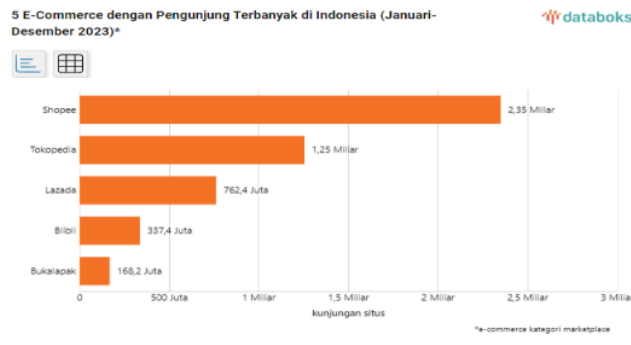
Gambar 1. E-Commerce dengan Pengunjung Terbanyak di Indonesia

individu menarik pelanggan dan membangun kepercayaan. Hal ini sangat penting dalam dunia bisnis online yang kompetitif (Munir 2023).