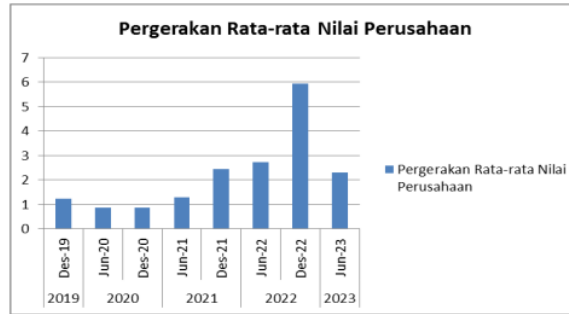
Gambar 1. Pergerakan Rata-rata Nilai Perusahaan Sub sektor Food and Beverage

konsisten terus positif, mulai dari perannya terhadap peningkatan produktivitas, investasi. Nilai perusahaan merupakan kondisi tertentu yang telah dicapai oleh suatu perusahaan sebagai gambaran dari kepercayaan masyarakat terhadap perusahaan setelah melalui suatu proses kegiatan selama beberapa tahun.