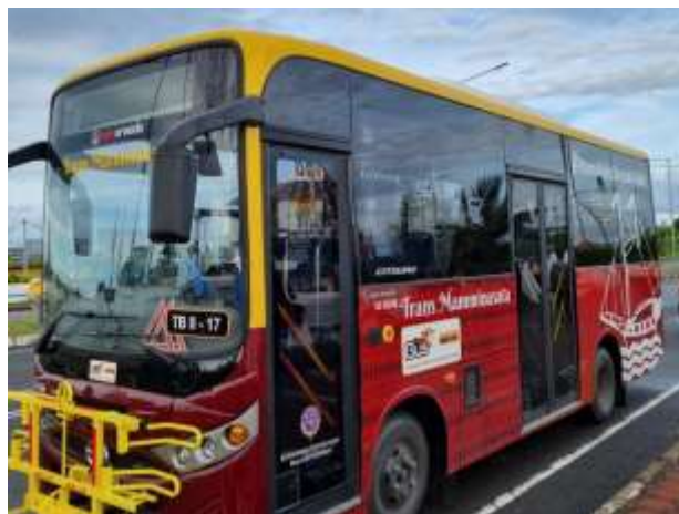
Gambar 3. Teman Bus Trans Mamminasata.