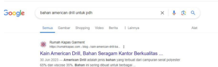
Gambar 2.3 Hasil SEO Artikel Search Google

Penerapan teknik SEO pada situs web www.rumahkapas.com melalui pembuatan konten artikel SEO secara konsisten selama satu bulan (4 minggu) menunjukkan hasil positif. Terlihat dari peningkatan nilai SEO dan SERP pada beberapa parameter. Hal ini menunjukkan bahwa konsistensi dalam mengunggah konten artikel SEO dapat meningkatkan nilai situs web dan nilai kata kunci di mesin pencari.