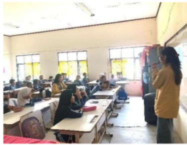
Gambar 3. Sesi pemateri

Materi yang ketiga yaitu 6 Dampak bullying pada pelaku, korban, dan orang yang melihatnya adalah bagian ketiga. Mereka yang melakukan pelecehan menjadi lebih agresif, tidak dapat menghargai orang lain, sering memaksakan pendapat mereka, bahkan menjadi pembangkang, rentan terhadap konflik, dan berpotensi menjadi kriminal. Korban bullying juga dapat mengalami gangguan mental, kurangnya keinginan untuk melakukan sesuatu, masalah kesehatan karena 24 pola makan dan tidur yang tidak teratur, dan penurunan prestasi akademik. Selanjutnya, dampak bagi orang yang melihatnya: mereka merasa bersalah karena tidak dapat membantu korban yang depresi karena takut jika ia menjadi target berikutnya, mereka mungkin meniru pelaku pelecehan dan pelecehan.