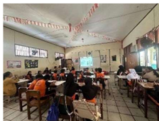
Gambar 1. Pembukaan kegiatan edukasi

Kegiatan sosialisasi/penyuluhan tentang pengaruh bullying terhadap kesehatan mental remaja di bangku smp dilaksanakan pada hari selasa, 4 Juni 2024 di SMP SANTA MARIA MONICA BEKASI melalui penyuluhan psikoedukasi pukul 11.00WIB s.d 12.15 WIB.