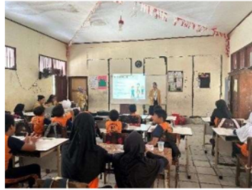
Gambar 2. Sesi pre-test dan post-test

Kegiatan psikoedukasi ini diikuti sebanyak 24 siswa/I SMP Maria Monica Bekasi, yang merupakan kelas 7 SMP. Sebelum masuk kedalam penyajian materi tentang dampak bullying bagi kesehatan mental seseorang, peneliti melakukan pre-test terlebih dahulu untuk mengetahui dan mengukur tingkat pengetahuan dan pemahaman siswa/I terkait materi yang akan disampaikan peneliti. Pertanyaan- pertanyaan yang diajukan kepada siswa/I pre-test dan post-test adalah berikut, “ apayang dimaksud bullying? ” ; “ apa yang dimaksud dengan bullying verbal? ” ; “ apasaja yang bisa menjadi tanda tanda seseorang menjadi korban bullying? ” ; “ yang termasuk perundungan fisik dari kasus-kasus berikut.. ”. Setelah dilakukan pre-test dan post-test terlihat peningkatan pengetahuan dan pemahaman tentang dampak bullying bagi kesehatan mental. Berikut grafik hasil pre-test dan post-test :