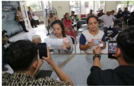
Gambar 2. Penyaluran BLT oleh Petugas Bank Jatim