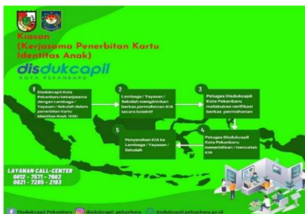
Gambar 6 Tata cara layanan Kiasan