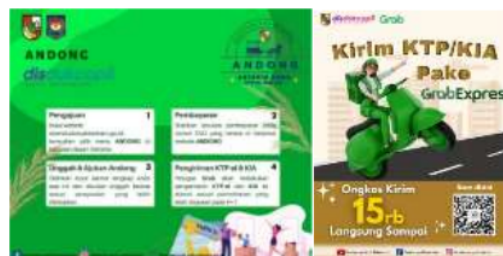
Gambar 3 Layanan Andong (Anterin Dong)