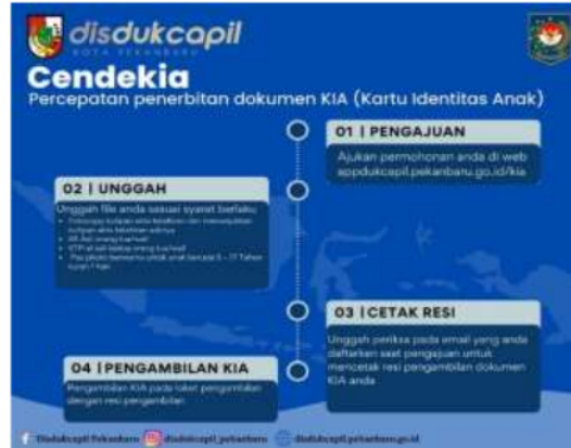
Gambar 1 Tata Cara pengajuan KIA pada Aplikasi/web Cendikia