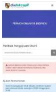
Gambar 8 Tampilan Layanan Cendikia