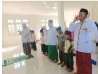
Gambar 1. Kegiatan Shalat Berjamaah

diterapkan setiap hari, Adapun yang terlibat dalam program tersebut adalah seluruh elemen yang ada di dalam MI Sunan Kalijogo.