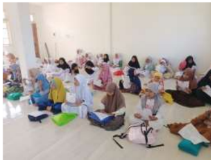
Gambar 2. Kajian Keagamaan

Program sholat berjamaah dilakukan setiap hari sebanyak 2 kali selama pembelajaran sekolah dilakukan. Adapun shalat yang dilakukan adalah shalat dhuha dan shalat dhuhur. Program ini dilakukan di masjid sekolah, Adapun yang menjadi imam adalah guru yang sudah dijadwalkan oleh sekolah, dan siswa bertugas sebagai muadzin dan iqamah . Tujuan dari program ini adalah menguatkan nilai keimanan yang dimiliki oleh peserta didik dan meningkatkan ketakwaan peserta didik.