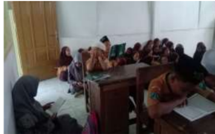
Gambar 3. Kegiatan MTQ

Program MTQ adalah kegiatan membaca Al-Quran yang dilakukan oleh semua peserta didik dan guru pengawas yang ada di MA Sunan Kalijogo. Program ini diterapkan pagi hari sebelum pembelajaran dimulai. Adapun tujuan dari program ini diterapkan adalah menguatkan pengetahuan dan cara membaca Al-Quran yang dilakukan oleh peserta didik.