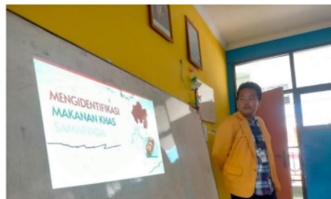
Gambar 3 Menyampaikan Materi Tentang Cara Mengidentifikasi Makanan Khas Samarinda di Kelas VIII

Setelah peserta didik mengenal terkait buah dan kue khas Samarinda, selanjutnya mereka akan mengidentifikasi berbagai macam buah dan kue khas yang ada di Samarinda secara berkelompok. 1 kelas terdiri tiga kelompok yang akan di acak oleh pemateri. Hasil identifikasi akan berbentuk laporan sebagai latihan tugas akhir pada P5 pada tema ini.