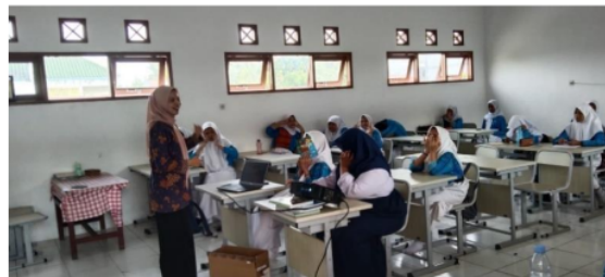
Gambar 2 Mengenalkan Buah Khas Samarinda di Kelas IX