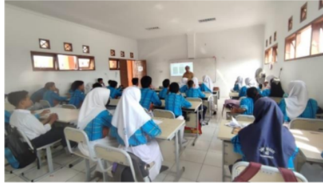
Gambar 4 Menyampaikan Materi Cara Mengidentifikasi Makanan Khas Samarinda di Kelas IX

(Sumber Data: SMP Negeri 48 Samarinda, 2024)