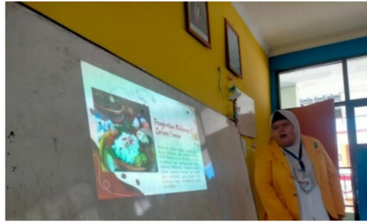
Gambar 1. Mengenalkan Kue Khas Samarinda di Kelas VIII