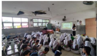
Gambar 5 Menjelaskan Materi Tentang Merancang dan Menyajikan Makanan Khas Samarinda di Kelas VIII

Dalam kegiatan ini peserta didik beserta anggota kelompoknya akan sekreatifitas mungkin untuk mengolah atau membuat makanan khas Samarinda, dengan mulai dari merancang kemasan yang digunakan serta penyajian makanan agar terlihat kesan yang menarik. Kemudian, peserta didik akan mempresentasikan hasil kerja kelompok mereka kepada guru untuk dinilai nantinya.