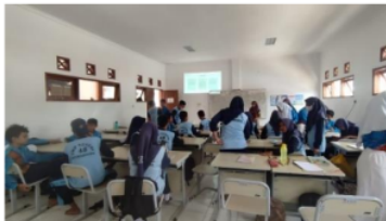
Gambar 6 Menjelaskan Materi Tentang Merancang dan Menyajikan Makanan Khas Samarinda di Kelas IX

(Sumber Data: SMP Negeri 48 Samarinda, 2024)