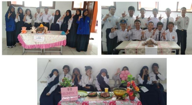
Gambar 1.8 Hasil Merancang dan Menyajikan Mempresentasikan Tugas Akhir P5 Pada Tema Kearifan Lokal Kelas IX