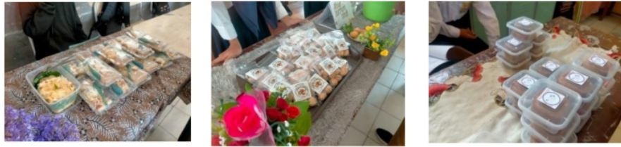
Gambar 1.7 Hasil Merancang dan Menyajikan serta Mempresentasikan Tugas Akhir P5 Pada Tema Kearifan Lokal Kelas VIII