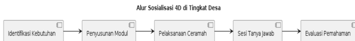
Gambar 1. Alur Sosialisasi 4D.

Diagram alur di atas memetakan tahapan sistematis dalam pelaksanaan program edukasi yang telah dijalankan di lokasi penelitian secara detail. Setiap fase dirancang untuk menjamin kontinuitas penyerapan informasi sebelum peserta beralih ke tahapan berikutnya yang lebih kompleks. Proses identifikasi kebutuhan menjadi fondasi utama agar materi yang disusun benar-benar relevan dengan kondisi lapangan aktual. Siklus ini memastikan bahwa transfer pengetahuan berlangsung terstruktur dan dapat diukur capaiannya secara objektif melalui instrumen standar. Visualisasi alur kerja ini memudahkan pemangku kepentingan dalam mereplikasi program ke desa lain.