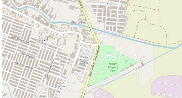
Gambar 2. Peta Tanjung Puri Kecamatan Sidoarjo Kabupaten Sidoarjo