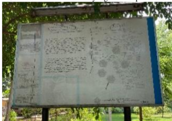
Gambar 6. Denah taman yang tidak dapat dibaca

mengatasi masalah saat ini dan apakah output yang dihasilkan cukup untuk mencapai efek yang diinginkan. Pada evaluasi pemanfaatan ruang terbuka hijau Taman Tanjung Puri yaitu ketersediaan fasilitas pada Taman Tanjung Puri tidak memiliki fasilitas yang memadai. Hal ini terlihat dari fasilitas bermain anak yang rusak dan tanaman yang tidak terawat. Kapasitas layanan Taman Tanjung Puri juga tidak dapat menyediakan layanan yang memadai. Hal ini ditunjukkan oleh pengunjung yang susah dalam mendapatkan informasi di taman seperti denah atau aturan yang ada di taman.