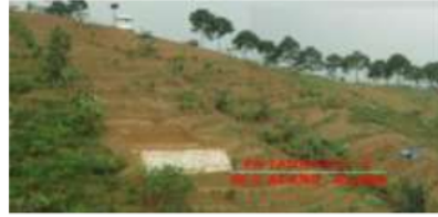
Gambar 1. Kondisi awal lokasi hutan organik yang sangat kritis

dukungan yang lebih besar dari para pemangku kepentingan, investor, dan pelanggan, yang akan memperluas pangsa pasar dan memberikan keunggulan kompetitif. Perusahaan yang menggunakan program TJSL akan mengalami peningkatan produktivitas dan pendapatan.