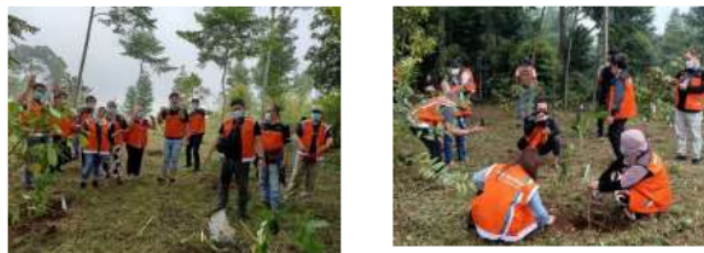
Gambar 2 Program BNI untuk Lingkungan (BNI Go Green) di Kawasan Hutan Organik Megamendung Puncak Bogor

Selain melaksanakan inisiatif CSR, PT BNI juga berdedikasi untuk berperan sebagai agen pembangunan, penggerak ekonomi dan melaksanakan inisiatif yang meningkatkan kesejahteraan masyarakat. Sebagai bank milik negara, BNI berkewajiban untuk berpartisipasi secara penuh dalam program 56 Tanggung Jawab Sosial Perusahaan. Hal ini termasuk berkontribusi 6 dalam inisiatif tanggung jawab sosial dan lingkungan bank yang sejalan dengan tujuan pembangunan berkelanjutan. Ada beberapa jenis program CSR yang ditawarkan oleh CSR PT BNI, yaitu: Sosial (BNI berbagi sosial bertujuan untuk mewujudkan masyarakat yang berkeadilan, sehat, berkualitas, dan sejahtera); Ekonomi (BNI berbagi ekonomi bertujuan untuk mendorong pertumbuhan ekonomi dan inovasi kelompok yang berkelanjutan); dan Lingkungan (BNI berbagi lingkungan bertujuan untuk mewujudkan pengelolaan sumber daya yang berkelanjutan dan pelestarian lingkungan serta memberikan 41 dampak positif bagi lingkungan dan kehidupan). Program BNI Go Green yang bertujuan untuk mengelola sumber daya alam dan lingkungan hidup secara berkelanjutan serta berkontribusi dalam meningkatkan kualitas kehidupan dan lingkungan hidup menjadi pokok bahasan dalam penelitian ini.